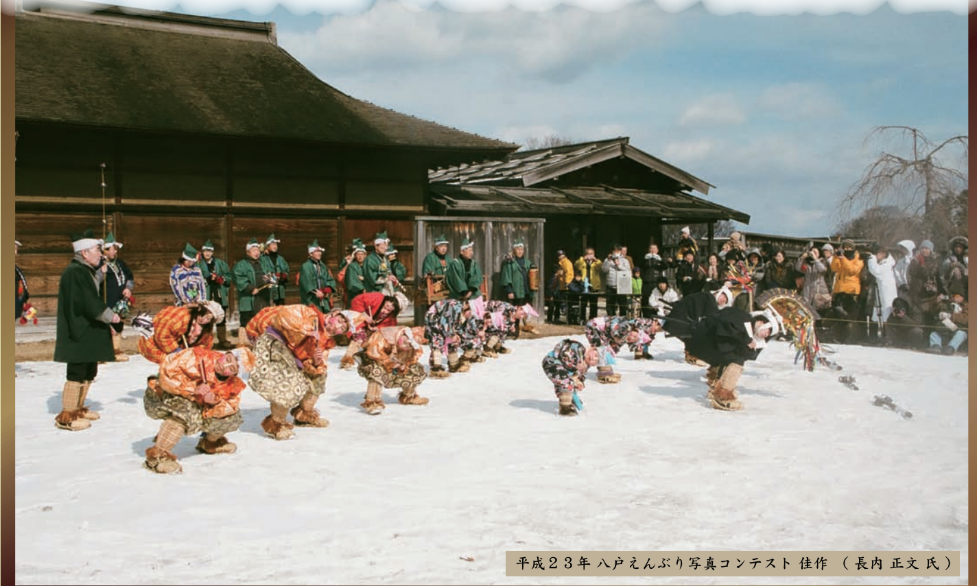
平成23年八戸えんぶり写真コンテスト 佳作 (長内正文氏)